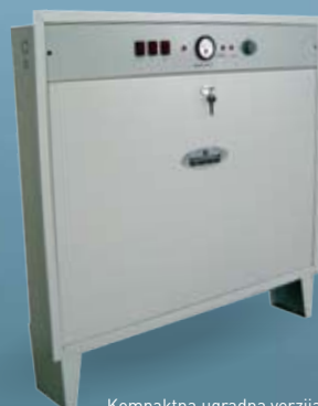
Kompaktna ugradna verzija - za jednoevne sisteme grejanja.