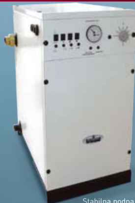
Stabilna podna postavka - kotao je pravilnog četvrtastog oblika.